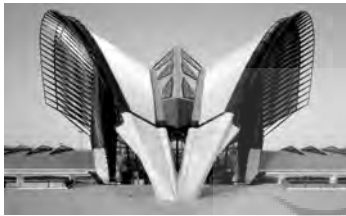
تصویر شماره ۳: فرودگاه لیون اثر کالاتراوا

به اندازه محاسبات سازه ای ارزشمند و حیاتی هستند. سازه‌های زیبا و باشکوه و تخیلات و احساسات پر شور را در بیننده به وجود می‌آورند. او در پی خلق فرم‌های نوینی است که بر مبنای دانش فنی شکل گرفته است. دریافت علمی و دانش فنی در کنار خلاقیت‌های کالاتراوا به آثار او جلوه‌ای خاص بخشیده است. این خلاقیت یادآور ارتباط تنگاتنگ علم و هنر است. در حقیقت فن در آثار کالاتراوا برای تجلی و بیان مباحث سازه ای به کار گرفته می‌شود و بدین ترتیب جسارت سازه ای معمار با بیان ساده و روان معماری او عجین می‌شود و اثر به صورت ترکیبی موزون از اصول فیزیکی ساختاری و زیبایی‌تجلی می‌یابد و اتفاقاً همین اصول سازه ای است که در آثار کالاتراوا تکلیف فرم را تا حد زیادی مشخص می‌کنند (تصاویر ۳ و ۴).