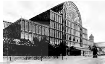
تصویر شماره ۱: قصر بلورین