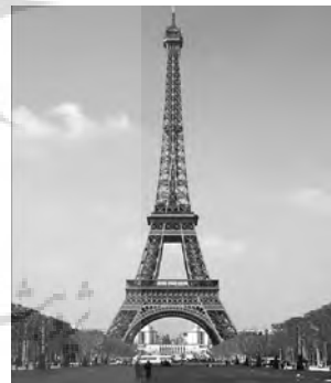
تصویر شماره ۲: برج ایفل

معماری پیاانو ۱۱ نیز نمونه کاملی از هنر و مهندسی در ساخت محسوب می‌شود. رنزو پیاانو فناوری را در خلق کارهای هنری به کار گرفته ولی هنوز اجازه نداده است که تسلیم آن شود. وی در کارهای معماری خود بیشتر به جنبه‌های انسان‌گرایی توجه دارد. پیاانو ساختارها را با تلفیقی از هنر و فن آوری پدید می‌آورد. اگرچه وی در کارهایش از جدیدترین فن آوری مدرن نیز استفاده می‌کند اما ریشه کارهایش در فلسفه ایتالیایی نهفته است و به عبارتی در کنار استفاده از فن آوری مدرن از قابلیت‌های فردی خود و فلسفه سنتی ایتالیا نیز همواره بهره می‌گیرد (بقایی، ۱۳۸۰) ۱۲ .