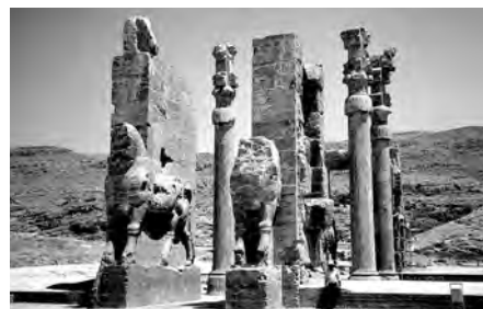
تصویر شماره ۵: تخت جمشید

در معماری حکومتی دوران هخامنشی، تامین انواع فضاهای مورد انتظار بر اساس سیستم های سازه ای ممکن صورت می گیرد. ایجاد فضاهایی که دارای ابعاد مختلف در طیف خرد تا کلان و ارزش ها و کارکردهای متفاوت هستند با استفاده از سیستم های سازه ای به ارث رسیده از گذشته گاه گزینش شده و آگاهانه (انتخاب نوع سیستم بر اساس کاربرد و استفاده) و گاهی نیز تجربه شده (تعمیم کاربرد سیستم سازه ای کارآمد) به ویژه خلاق، محقق می گردد. شکل سیستم سازه ای شامل ترکیب تیر و ستون و دیوار باربر، اگر چه ریشه در روش های ساختمانی ماقبل خود دارد، در عین حال واجد ویژگی هایی نو و منحصر به فرد است، که در مجموع در راستای هماهنگی با فرهنگ فضا قرار می گیرد. ایجاد تعالی، شوکت و عظمت در دو جنبه معنوی و به ویژه دنیوی، به زبان رمز، عامل تشخیص فضای معماری محسوب می شود که به واسطه سیستم سازه ای، شکل جسمانی خود را می یابد. سیستم سازه ای نیز ضمن اتکا بر زبان سازه ترکیبی از تیر و ستون و دیوار باربر از چوب و سنگ یا چوب و سنگ و خشت خام در جستجوی یافتن روش ممکن برای بیان فضای مورد نظر، مبتنی بر زبان رمزی می شود (تصویر ۵).