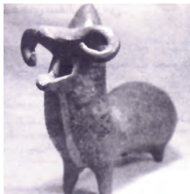
تصویر شماره (۱): مجسمه سفالین مجوف به شکل قوچ، سطح قهوه ای رنگ داغدار شده، ۳۳ × ۲۹ سانتی متر، مارلیک، سده ۹ و ۸ ق.م، (حفاری های مارلیک، عزت الله نگهبان، انتشارات سازمان میراث فرهنگی کشور، تهران: ۱۳۷۸، ص ۴۰۵).

بررسی آثار هنری سفالگران پیش از اسلام تاریخ ایران زمین حاوی مفاهیم ارزشمند و معرف نوع نگاهی پویا و تکامل یافته است، که ما را به بینش ژرف و توانمندی صنعتی و تکنیکی عمیق هنرمندانه ایشان رهنمون می سازد. اجازه بدهید به همین منظور با نگاهی امروزی نقبی به ارزش های انتزاع گرایانه سفالینه های جانوری بزنیم و یکبار دیگر طرز تلقی هنرمندان این گونه دست ساخته های سفالین را مرور کنیم.