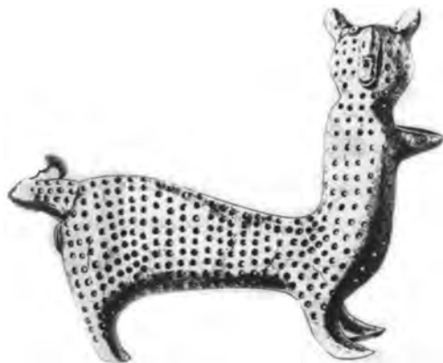
تصویر شماره (۳): مجسمه سفالین مجوف به شکل پلنگ، به رنگ تیره خاکستری مایل به قهوه ای ۳۴ × ۲۷/۵ سانتی متر، مارلیک، سده ۹ و ۸ ق.م، (حفاری های مارلیک، عزت الله نگهبان، انتشارات سازمان میراث فرهنگی کشور، تهران: ۱۳۷۸، ص ۴۱۰).

"انتزاعی گری" به عنوان یک روند هنری تا حدود بسیار زیادی به ذاتگرایی تمایل دارد. هنرمندان مدرن حداقل تا اواسط قرن بیستم، علت گرایش به انتزاعی گری را مبتنی بر این باور اعلام کردند که شکل خالص تر، والا تر و عمیق تر و یا جهانی تر از واقعیت، از طریق کنار گذاشتن تدریجی جنبه های فرعی و غیر ضروری اشیاء آشکار می شود. حتی آن را با دیدگاه نو افلاطونی نسبت می دادند که جوهر یا ذات های اساسی و جهانی وجود دارند که آنچه ما می بینیم و با آن روبرو هستیم نمونه های ناقص و ناخالص آنها هستند. از این رو نگرشی در