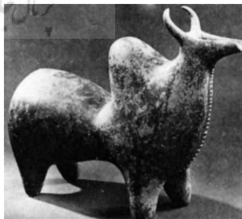
تصویر شماره (۴): مجسمه سفالین گاو کوهاندار، مکشوفه در جنوب غربی دریای خزر، سده ۹ ق.م. موزه متروپولیتن نیویورک، (هنرهای ایران، ر. دبلیو فریه، ترجمه پرویز مرزبان، انتشارات فرزاد روز، تهران: ۱۳۷۴، ص ۱۰).

آنچه یک "سفالینه با فرم جانوری" انتزاع‌گرایانه را از یک دست ساخته کاربردی صرف سفالین متمایز می‌گرداند، نوع توجه به ظرفیت‌های زیبایی‌شناسانه آن از جمله حرکت، پویایی،