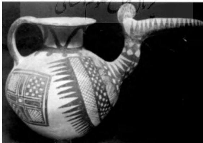
۷. تصویر شماره (۷): قوری مشابه به سر و منقار پرنده، نخودی رنگ، ۲۱/۵×۳۲، سی‌یلک، سده ۸ و ۹ ق.م، (سفال و سفالگری در ایران، سیف‌الله کامبخش فرد، انتشارات ققنوس، تهران: ۱۳۷۸، ص ۵۱۷).

با معرفی این حجم گسترده از سفالینه‌ها که اغلب در مکان‌های مذهبی و مکان‌های تدفین اجساد یافته شده و نسبت آن با مراسم آیینی کاملاً محرز و قابل اثبات است می‌توان به این نتیجه رسید که بخش اعظمی از سفالگری ایران در خدمت این گونه مراسم بوده است لذا انگیزه دیگری افزون بر جنبه‌های مصرفی و خانگی و تزیینی و زیبایی‌شناسی در سیر تحول سفال‌گری ایران شکل گرفته بود. نشانه‌شناسی مورد اخیر (انگیزه‌های مذهبی و آیینی) اطلاعات جامعی از نوع جهان‌بینی و انگاره‌های ذهنی معطوف به مسائل مربوط به اعتقادات و هستی‌شناسی انسان آن دوران به دست می‌دهد. امید است در فرصت‌های مناسب و تحقیق‌های بعدی به این مقوله مهم نیز پرداخته شود.