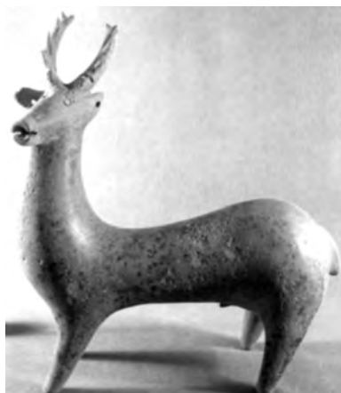
تصویر شماره (۲): مجسمه سفالین مجوف به شکل گوزن، قرمز آجری صیقلی شده، ۳۰ × ۲۷/۵ سانتی متر مارلیک، سده ۹ و ۸ ق.م، (حفاری های مارلیک، عزت الله نگهبان، انتشارات سازمان میراث فرهنگی کشور، تهران: ۱۳۷۸، ص ۵۰۸).