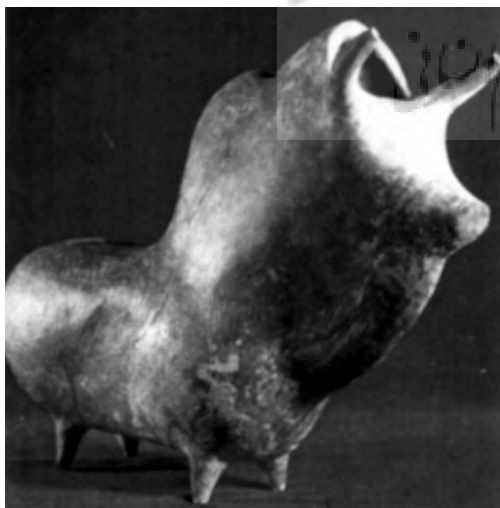
تصویر شماره (۶): مجسمه سفالین مجوف به شکل گاو، قرمز مایل به قهوه‌ای با پوسته درخشان، ۲۶/۵ × ۳۲/۵، املش، هزاره اول ق.م. (سفال و سفالگری در ایران، سیف‌الله کامبخش فرد، انتشارات ققنوس، تهران: ۱۳۷۸، ص ۵۱۸).

هنر قرن بیستم شکل گرفت که در پی آن هنرمندان قائل به این نظریه، بر این باور متفق القول اذعان داشتند. "هنرمند کسی است که به درون پنهان دنیای مادی نفوذ کند تا حقیقت معنوی ذات آنرا آشکار نماید" یا به تعبیر کاندینسکی: "ایده‌آل انتزاع، به امتیازات بیشتری دست می‌یابد" (کاندینسکی، ۱۳۷۹، ۹۵).