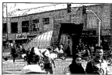
ورودی مترو ۱۵ خرداد (تهران)