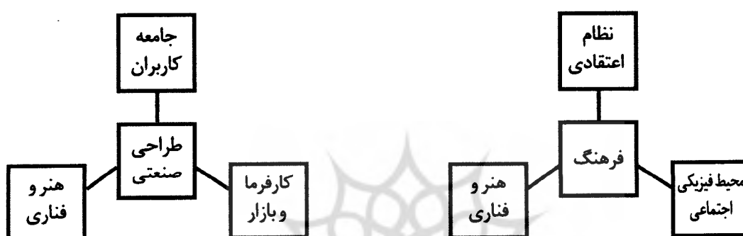
نمودار شماره ۱. مقایسه مؤلفه‌های تاثیر گذار بر فرهنگ و طراحی صنعتی

این همانندی‌ها صرفاً به حوزه اثرگذاری محدود نمی‌شود، بلکه اشتراکات عمیقی میان ریشه‌های طراحی صنعتی و فرهنگ قابل تعریف است: