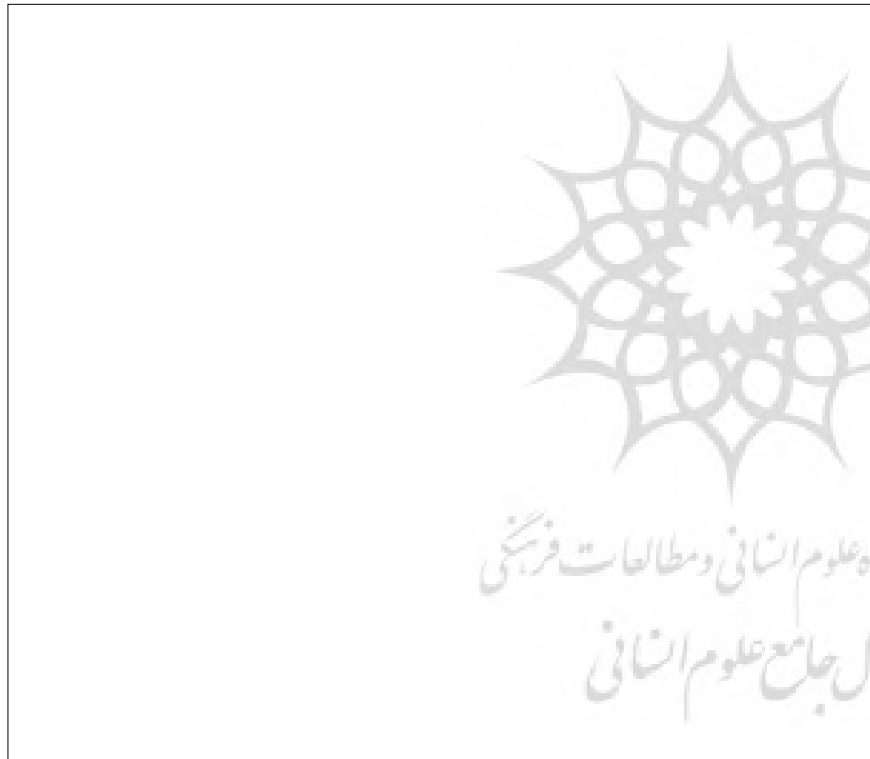
② سهام ضعیف در صنعت قوی، بهتر از سهام قوی در صنعت ضعیف است.

D_1 = سود نقدی موردانتظار در پایان سال اول. K = نرخ بازده موردانتظار سرمایه‌گذاران. g_1 = نرخ رشد از سال صفر تا t . g_2 = نرخ رشد از سال t به بعد. در مدل بالا، هرچه نرخ رشد بیشتر باشد و یا دوره زمانی تا t بیشتر باشد، ارزش سهام بیشتر است.