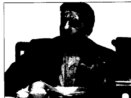
▲ محسن بهرامی، سهمیه واردات به مناطق آزاد رعایت نمی‌شود.

در این رابطه، محسن بهرامی، معاون سابق وزیر بازرگانی می‌گوید: قانون هر چند که هیچ حد و مرزی را برای واردات کالا به مناطق آزاد قایل نشده، اما سهمیه‌ای را برای واردات مجاز دانسته است که به دلیل نبود نظارت کنترلی بر واردات، برخی مواقع این سهمیه رعایت نمی‌شود.