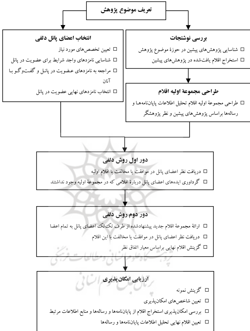
شکل ۱. روش پژوهش