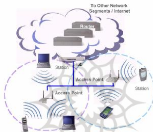
شکل 2. پیکربندی شبکه های مبتنی بر AP

ناحیه ای که توسط یک AP، تحت پوشش قرار می گیرد، سلول 1 نامیده می شود. هر ایستگاه کاری در داخل یک سلول می تواند به AP دسترسی پیدا کند. وسعت ناحیه تحت پوشش یک AP متغیر است و به طراحی و ساخت AP، محیطی که در آن کار می کند و قدرت ارسال کنندگی آن، بستگی دارد (Drew 2006) (شکل 2).