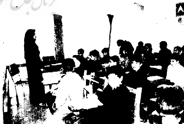
همکاری دانش آموزان با یکدیگر در کلاس، سامانه های

این اثر مداخله در گروه های سنی متفاوت، و در مدارس ابتدایی (۱۵-۱۴) و در نوجوانی اولیه و ثانویه نشان داده شده است. در بررسی طولی کیلام ۳ ، جو کلاسی ضعیف در پایه ی اول با مشکلات رفتاری بعدی در پسران (نه دختران) ارتباط دارد و همچنین اثر مداخله فقط در مورد نشانه های پسران بود. این بررسی ها نشان می دهند که ارتباط بین جو کلاس و مشکلات برون نمود در پسران بیشتر از دختران است.