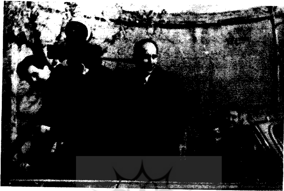
در تدارک یک صحنه (شب‌نشینی در جهنم)

موردنظر بوده است. چاپ دو یا چند عکس صحنه بر روی یک کاغذ از شکل‌های دیگری بود که عکاسان صحنه برای جلب توجه بیشتر به عکسها یا به منظور ارائه شرح یک صحنه از فیلم که از چند پلان تشکیل یافته بود، انجام می‌دادند.