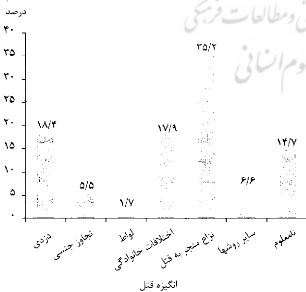
نمودار ۳- توزیع فراوانی مقتولین شهر تهران از اول مهر ۱۳۸۲ تا آخر شهریور ۱۳۸۳ بر حسب انگیزه قتل

قتل با انگیزه اختلافات خانوادگی در زنان (۴۰/۸٪) بیشتر از مردان (۱۲٪) بود، در حالی که قتل با انگیزه نزاع‌های منجر به قتل مختص مردان بود (۴۴/۲٪). قتل با انگیزه تهاجم جنسی در زنان (۲۵/۴٪) خیلی بیشتر از مردان (۲/۶٪) بود. نتایج آزمون آماری نیز