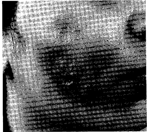
شکل شماره ۳

پس از آخرین تزریق دچار تورم شدید صورت گردید. از همان موقع دل پیچه متناوب نیز در وی ایجاد شد. بیمار از اضطراب شدید، بی-حوصلگی شکایت داشت و اظهار می داشت که پرخاشگر هم شده است. به مدت چندین ماه از قرص پردنیزولون ۵ میلی گرم استفاده کرد. چند تزریق Kenacort و Triamcinolone در زخم هم داشت. در معاینه هر دو طرف صورت برجسته و متورم است و در لمس Lump دو طرفه در چین خنده و گونه دارد (شکل شماره ۵).