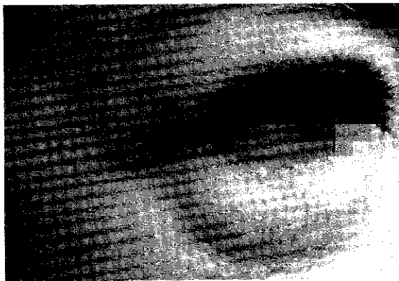
شکل شماره ۶

۵ - خانم ۳۵ ساله متأهل دارای ۲ فرزند، ۸ ماه قبل برای اصلاح چین خنده و بزرگ کردن گونه تزریق ژل در ۳ نوبت داشت. دو هفته