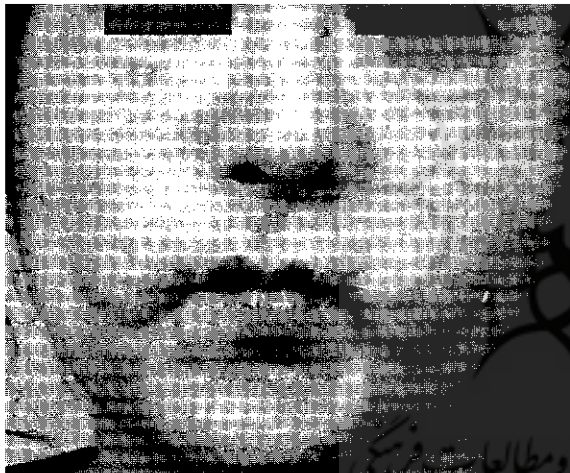
شکل شماره ۲

۲ - خانم ۳۴ ساله مجرد جهت اصلاح چین بین ابروها و چین نازولیبیال تزریق ژل شد. طی ۵ سال پس از ۵ بار تزریق توسط جراح اول تحت عمل جراحی تخلیه ژل قرار گرفت. در هنگام معاینه چندین توده در نواحی کنار بینی و گوشه لب بالا داشت. در ناحیه کناره بینی در پوست روی ناحیه توده عروق ریز فراوان دیده می شد. لب بالا حرکت طبیعی نداشت و نمایش دندانها برای بیمار مقدور نبود. به علت سنگینی توده ها پوست صورت آویزان شده و چهره از حالت عادی خارج و به شکل صورت شیر درآمده بود. به علت افتادگی بیش از حد صورت یکبار تحت عمل جراحی با روش کشش صورت (Classic Face Lift) قرار گرفت ولی به علت چسبندگی فراوان و فیروز شدید امکان کشش کامل میسر نشد (شکل شماره ۲).