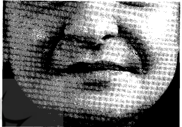
شکل شماره ۷

۷ - خانم ۲۸ ساله متأهل دارای یک فرزند جهت اصلاح چین خنده به پزشک مراجعه کرده بود. برای وی تزریق دو طرفه ژل انجام شد. پس از یک هفته صورت بیمار متورم شد و پزشک معالج از آنتی بیوتیک استفاده کرد. تورم تبدیل به آسسه شد و به علت Fluctuation چندین بار تخلیه انجام شد. پس از چند هفته درناژ چرک و ترشح از زخم ها، در چند جای صورت حالت گودی ایجاد شد (شکل شماره ۷).