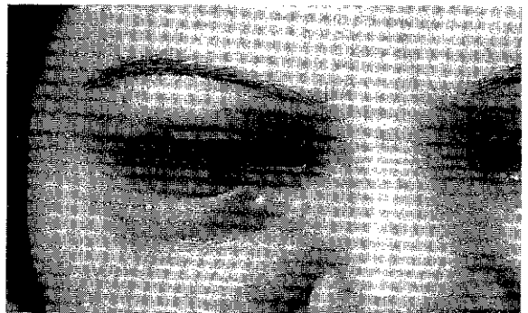
شکل شماره ۸

۸ - خانمی ۴۰ ساله متأهل دارای ۳ فرزند که چهارسال قبل به دلیل اخم بین ابروها به پزشک مراجعه کرده بود. در مرحله اول تزریق ژل در ناحیه بین ابروها انجام شد. پس از چند روز تزریق در ناحیه گونه ها انجام شد. چند روز بعد از تزریق در ناحیه کناره بینی آسسه تشکل شد که ژل همین ناحیه توسط پزشک معالج تخلیه گردید. به علت گود شدن گونه ها و ایجاد بدشکلی یک سال بعد توسط پزشک دیگری Dermofat گذاشته شد. به علت عود تورم شدید گونه ها، به مدت ۶ ماه از بنامتازون LA استفاده شد. درحال حاضر دفرمیتی نسبی صورت موجود است و تورم عودکننده در ناحیه صورت دارد.