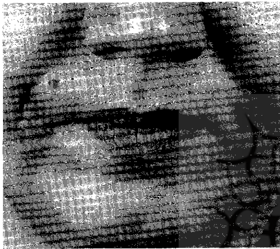
شکل شماره ۵

۴ - خانم ۳۸ ساله دارای دو فرزند جهت اصلاح چین خنده و برجسته کردن گونه تزریق ژل داشت. دو هفته پس از تزریق تورم شروع شد. پس از بروز این حالت پردنیزولون ۵ میلی گرم ۷ قرص در روز (به صورت کاهنده)، آنتی بیوتیک و تریامسینولون تجویز گردید. در معاینه تورم و Lump بزرگ در دو طرف صورت دارد و در داخل دهان نیز حالت گره لمس می شود ( شکل شماره ۴).