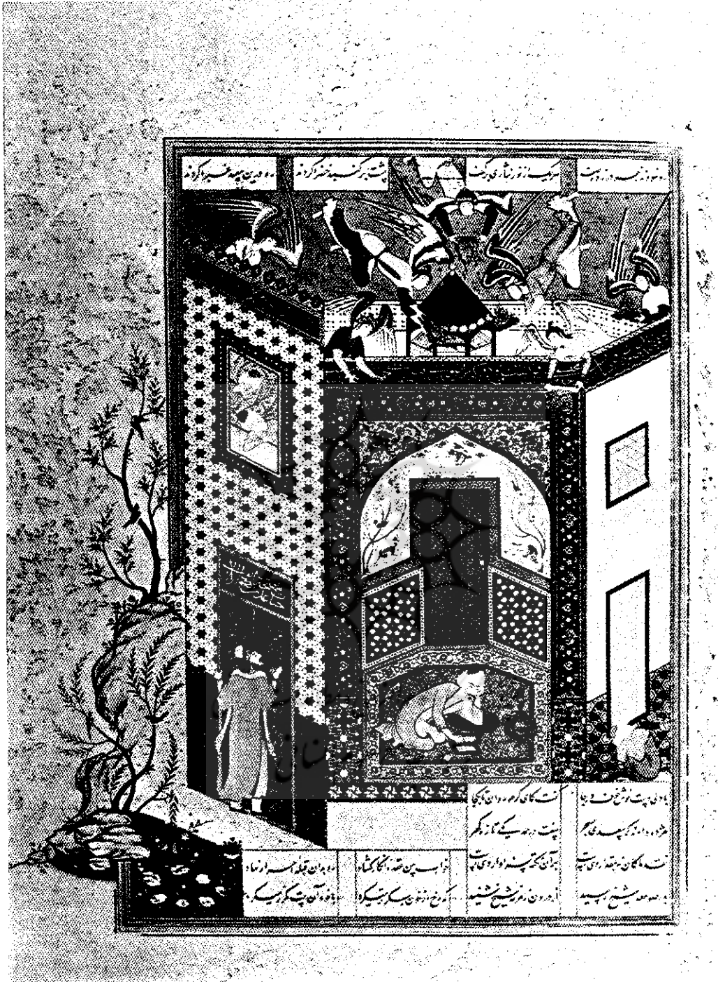
تصویر شماره ۳: جامی - هفت اورنگ - شیخ در حال تفکر در خانه اش - مشهد ۱۵۶۵ - ۱۵۵۶ میلادی.