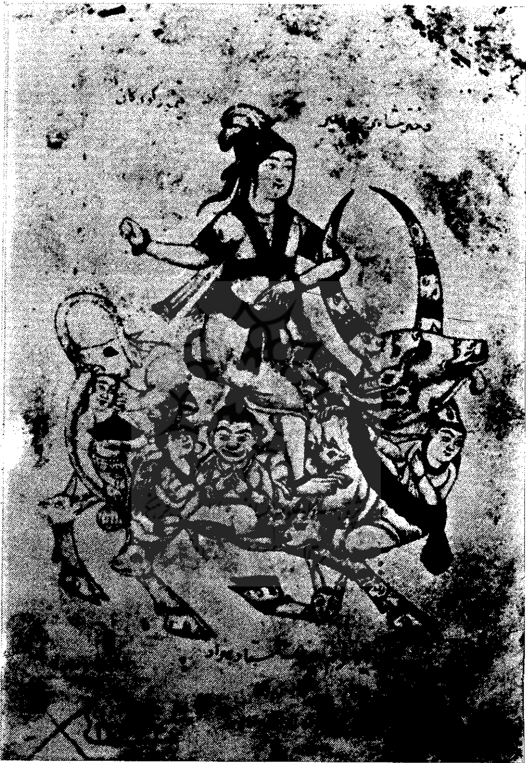
تصویر شماره ۸ : زن سوار بر گاو مسلوب به بهراد - هرات قرن پانزدهم میلادی (ق. ه. ق.)