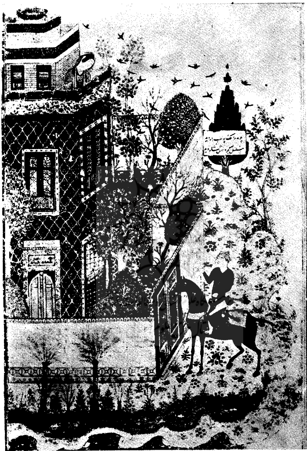
تصویر شماره ۹: عراجوی کرمانی - سه شرف‌های پشت در قصر مازان - اتریش - بغداد - ۱۳۹۶ میلادی