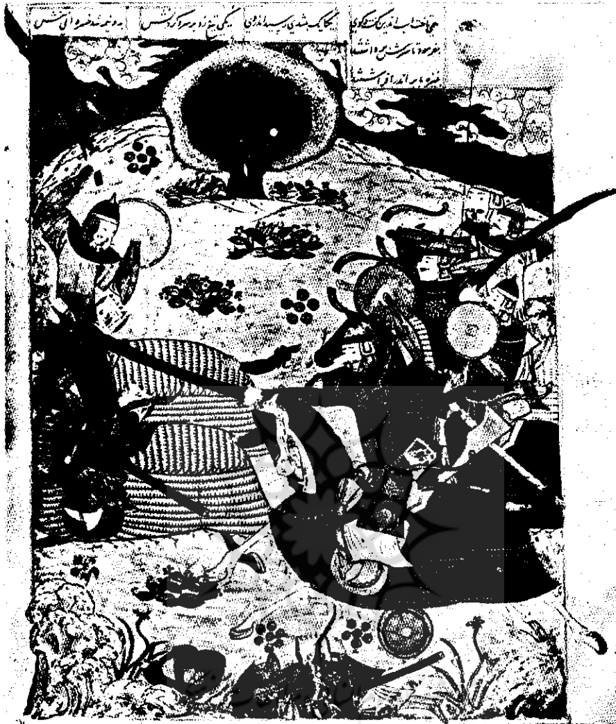
تصویر شماره ۱۱: نورسی - شاهنامه - منوچهر در حال کشتن سبزه (۱۴۴۴ میلادی)

مورخ ۱۴۲۲ میلادی می بینیم. جهان مذهبی و عرفانی مستقیماً و نه از طریق نمادها بتصویر می آید و دقیقاً بازتاب «عرفان» سهروردی است. مهمترین اثری که این حالت عرفانی را بتصویر درآورده «معراج نامه» است. مینیاتورهای کتاب «معراج نامه» بخاطر حالت شاعرانه رنگها که تشکیل مناظر انتزاعی را می دهند یک شاهکار است که در عین حال بوسیله واقعیت های فیزیکی محدود نشده اند. نقاشی اسلامی در این اثر نه تنها انسان معمولی، بلکه «انسان کامل» را نشان می دهد، انسان عارف و واسطه های میان خداوند و انسان را. این مینیاتورها شاید جزء معدود آثاری در نقاشی جهان باشند که در آنها هنرمند به بهترین طریق احساس عرفانی، یعنی سیر روح در آسمان و سعادت ازلی را از طریق نقاشی پخته نشان می دهد.