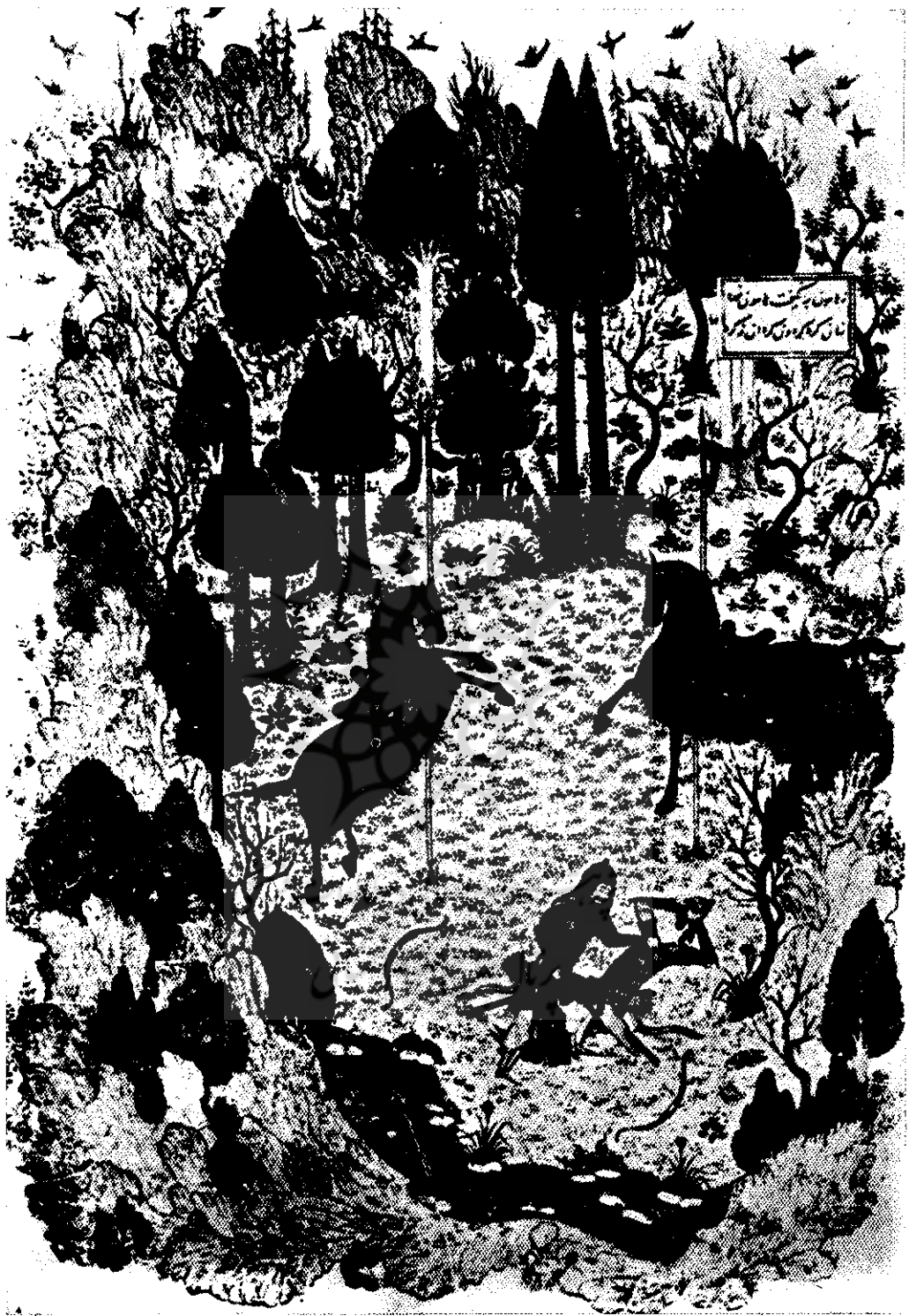
تصویر شماره ۱۰: خواجه کرمانی - سه شهر - جلال میان هما و هماپون - آثر مجید - بغداد - ۱۳۹۶ میلادی