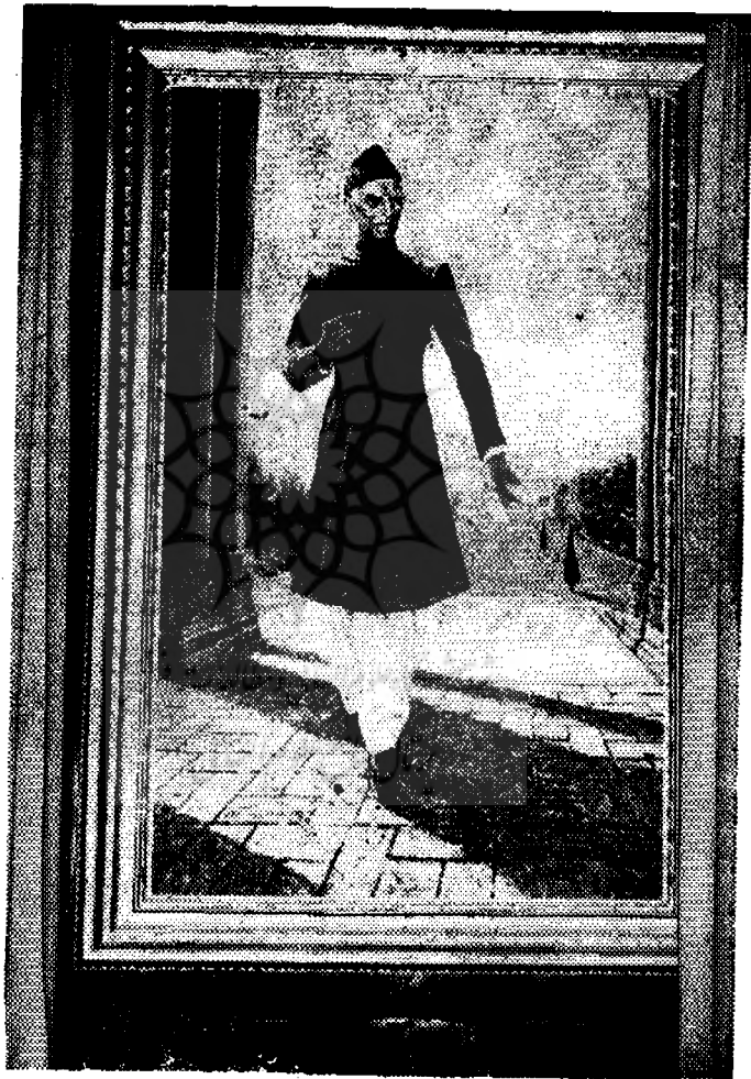
قائد اعظم جناح