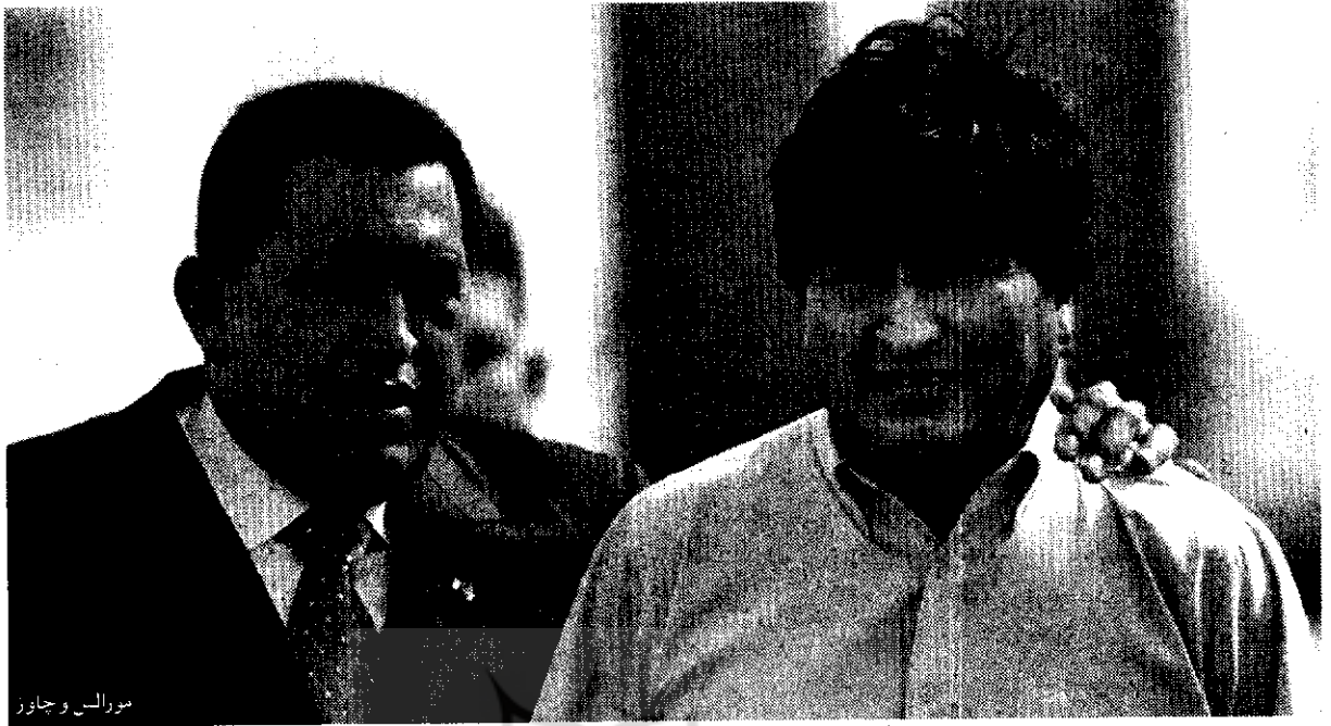
مورالس و چاوز

نمود. شکست اخیر ونزوئلا برای داشتن یک کرسی موقت در شورای امنیت سازمان ملل نیز به حیثیت منطقه‌ای چاوز صدمه زد. از این گذشته، وابستگی کنونی ونزوئلا در تجارت با تعدادی از شرکای منطقه‌ای امریکای لاتین، قدرت چاوز را در تغییر اساسی موازنه قدرت در نیمکره محدود می‌کند.