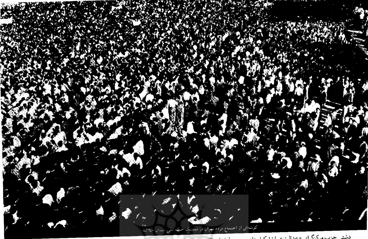
گوشه‌ای از اجتماع برده تهران در مسک حبه نمی شد در سال ۱۳۲۳

یافت که حتی در انتخاب اعضای کابینه هم دخالت می‌کرد و اگر فرد ضعیفی (دوره محمد ساعد) در رأس دولت قرار می‌گرفت تفکیک وظایف قوه مجریه و مقننه از همدیگر مشکل بود. (مجله آینده، ج ۳، ش ۱، مهرماه ۱۳۲۳، صص ۵۰-۴۸)