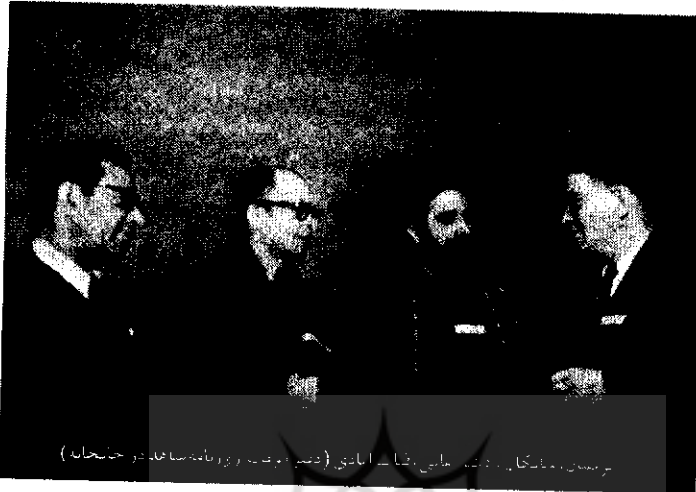
رئیس، ملکای، دکتر، مابین، قاضی، ابادی (دستور، روزنامه، ساخا، دو، خاندان)

خود را مستحکم نموده و خود را از استیلای طبقه بالای سنتی و دولت خارج نماید. آنها می‌خواستند از خلأ قدرتی که در ساختار سیاسی به وجود آمده بود بهره‌مند شوند به همین جهت اقدام به تشکیل حزب و سازمان سیاسی نمودند، حزب توده مهم‌ترین حزبی بود که در سال ۱۳۲۰ اعلام موجودیت کرد، هسته اصلی آن از برخی